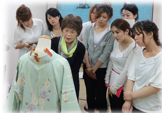
※授業は人間モデルで行います